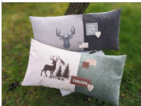
10. Das Kissen auf die rechte Seite wenden, die Ecken gut ausformen und die Füllung einschieben.