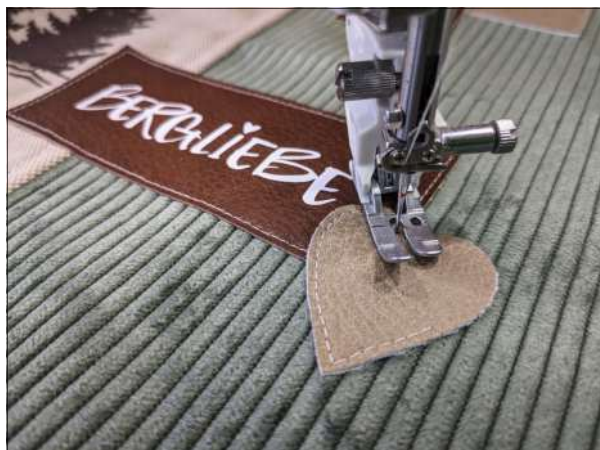
5. Die Patches mit Sprühkleber fixieren und dann knappkantig aufsteppen.