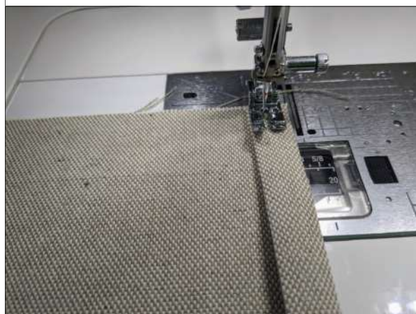
8. Die beiden Rückenteile jeweils an einer kurzen Seite 2x 1cm säumen.