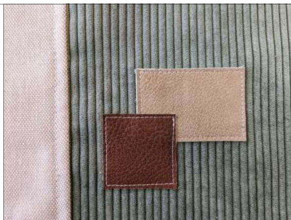
6. weiteres Bild dazu