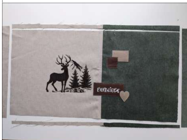
7. Die Kissenplatte auf 33cm x 63cm zuschneiden.