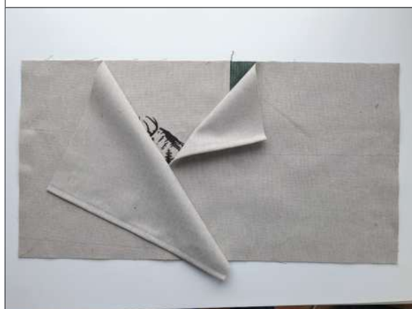
9. Die Rückenteile, an den gesäumten Kanten überlappend, auf der Kissenplatte re auf re auflegen, rundherum mit 1cm NZG zusammennähen und anschließend versäubern.